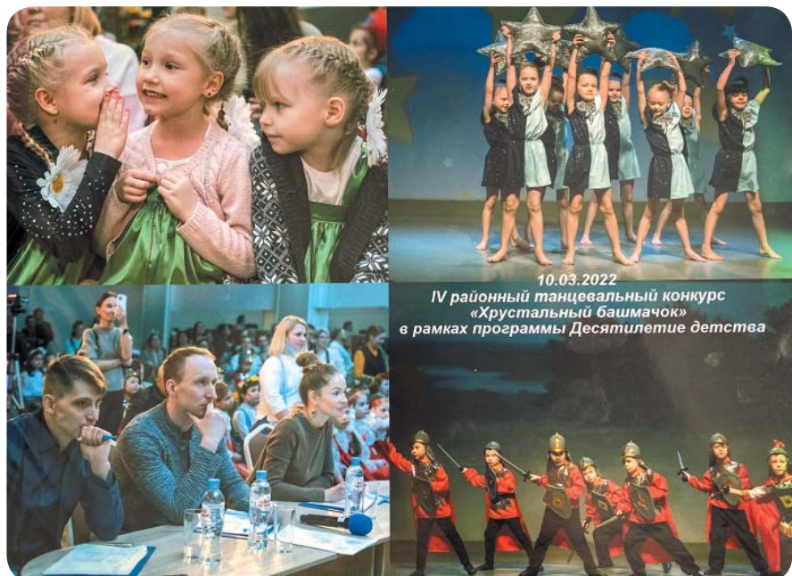
10.03.2022 IV районный танцевальный конкурс «Хрустальный башмачок» в рамках программы Десятилетие детства