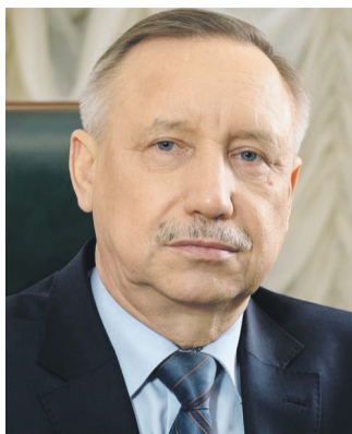
Александр БЕГЛОВ, губернатор Санкт-Петербурга