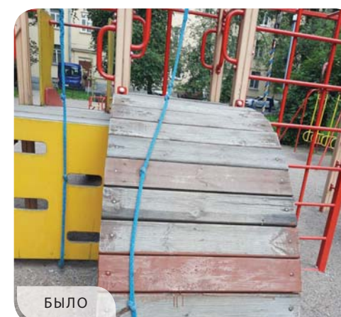
Большой Сампсониевский проспект, дом 92