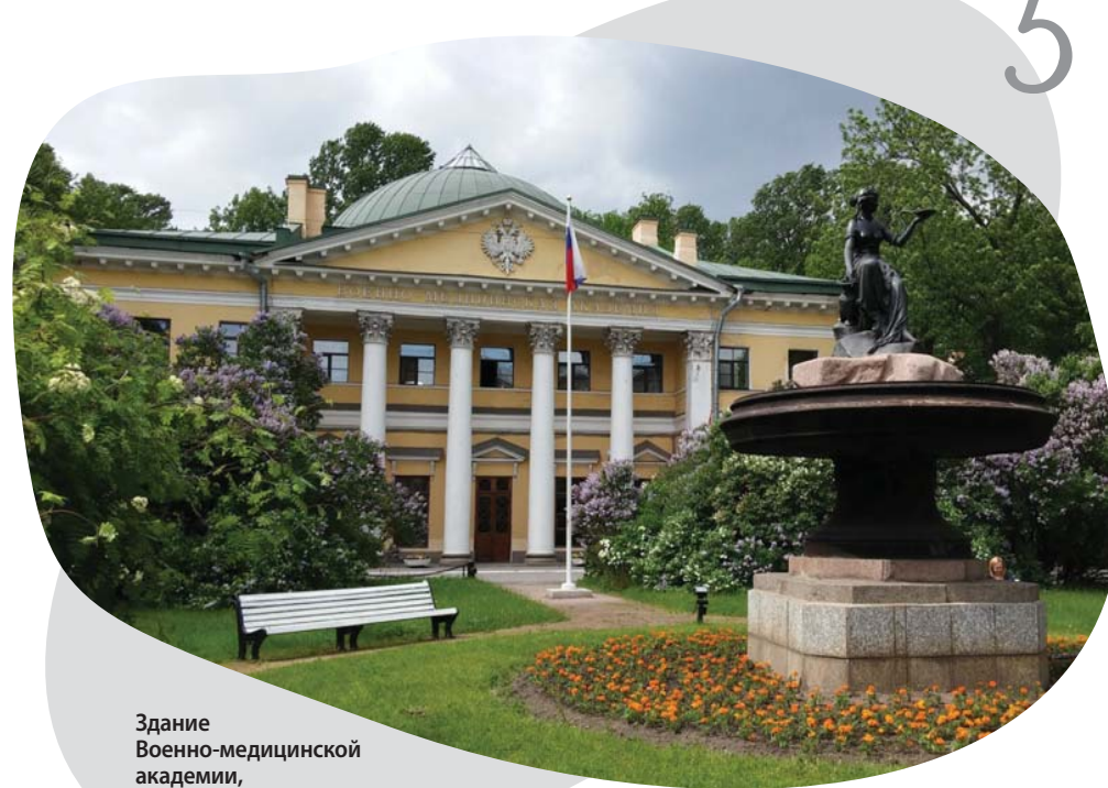
Здание Военно-медицинской академии, ул. Академика Лебедева, 6Ж.

которые спасли советский народ от фашизма, был бы невозможен без военных врачей. Благодаря им многие солдаты остались живы, вернулись в строй и одержали Победу. Образ военного медика останется олицетворением высокого гуманизма, мужества и самоотверженности.