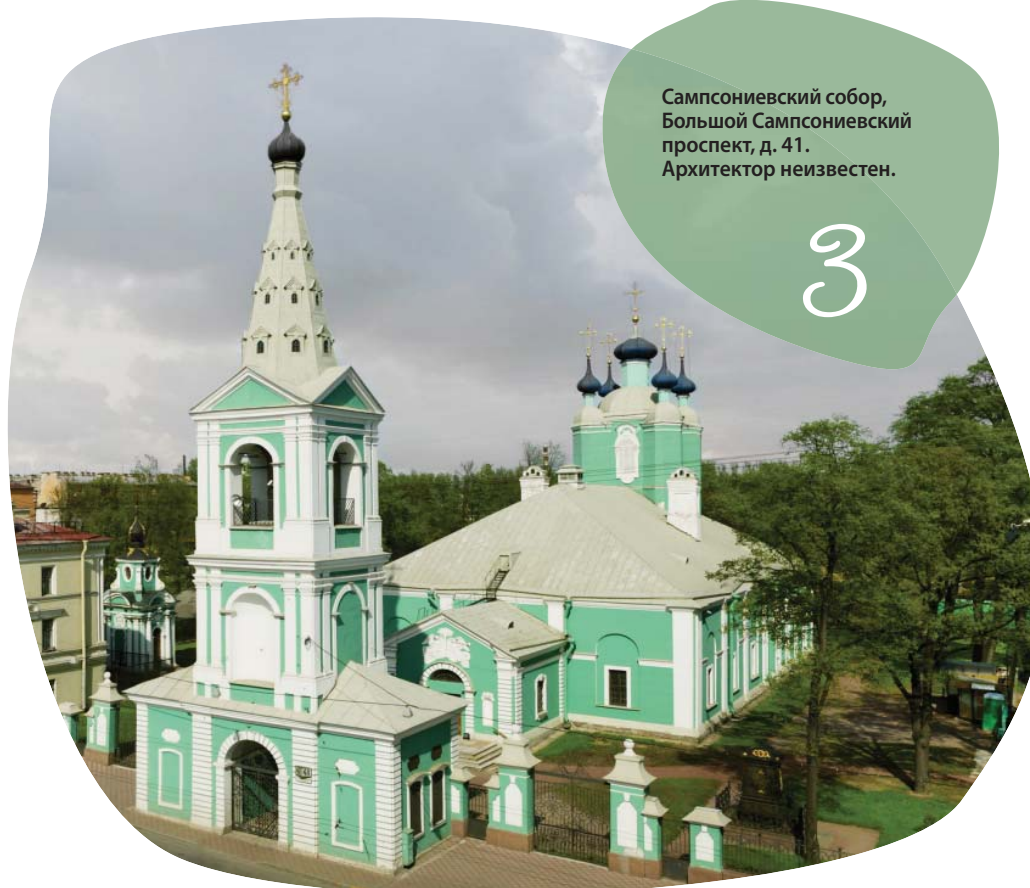
Сампсониевский собор, Большой Сампсониевский проспект, д. 41. Архитектор неизвестен.

Дом, архитектором которого является швед по происхождению Федор Ливаль, принадлежал крупному промышленнику Людвигу Нобелю, который сдавал жилье внаем своим наиболее ценным сотрудникам. Дом носит характерные черты столь любимого Ливалем стиля «северный модерн», а местами – даже архитектуры эпохи Ренессанса.