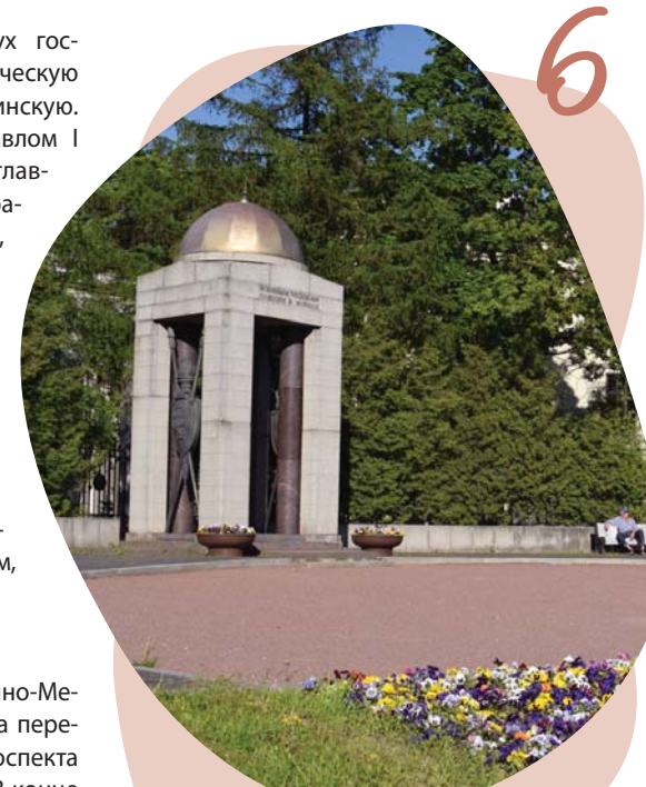
Площадь военных медиков.

В годы Великой Отечественной войны военные медики спасали жизни людей. Врачи вернули на фронт почти 18 миллионов солдат и офицеров. Это значит, что войну выиграли также и раненые и, в конечном счете, военные медики. Подвиг наших дедов и прадедов, Уверены, вы знаете еще много интересных уголков в нашем округе. Вы можете самостоятельно решить, откуда начинать прогулку, сколько и в каком порядке достопримечательностей посетить и, возможно, вы добавите что-то свое. Приятного отдыха!