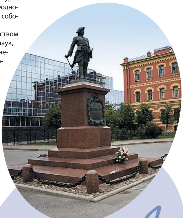
Памятник Петру I перед Сампсониевским собором.

В Санкт-Петербурге установили его точную копию, так как оригинал до сих пор находится в Третьяковской галерее.