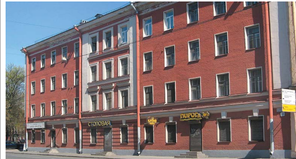
Офицерский корпус (Б. Сампсониевский, 59)