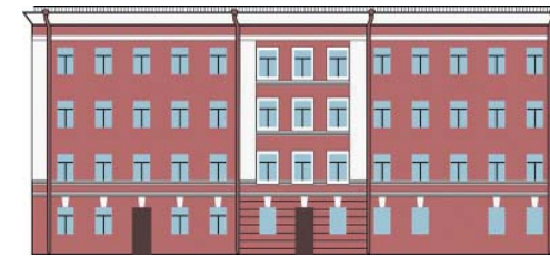
Автор офицерского корпуса – архитектор Андрей Карбоньер.

В 1817-1890 полк дислоцировался в Казармах местных войск на набережной реки Фонтанки, д. 90, затем Московский полк переехал на Выборгскую сторону в специально построенные казармы. В настоящее время дом используется как жилой.