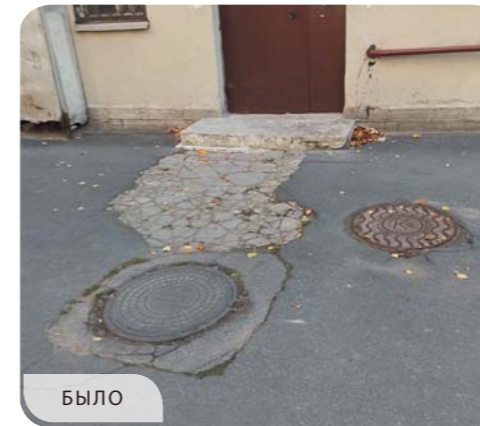
Финляндский проспект, дом 1