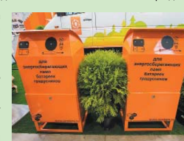
Расписание Экомобиля тел. 8 (931) 989-61-45