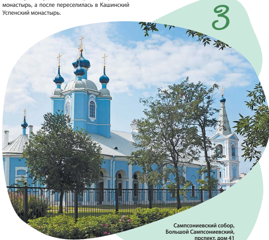
Сампсониевский собор, Большой Сампсониевский прспект, дом 41

Строительство существующего каменного храма было начато в 1728 году. В 1733 году были освящены боковые приделы, а в 1740 году – главный алтарь. Имя остается архитектора неизвестным.