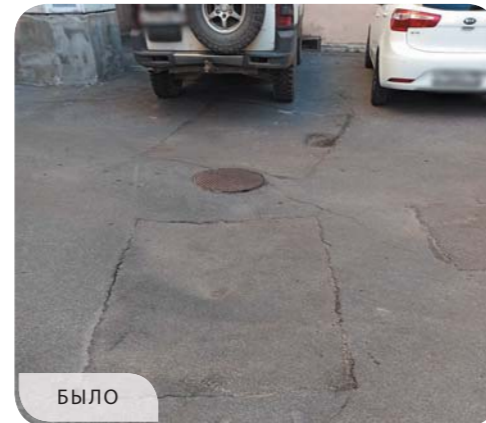
Нейшлотский переулок, дома 5, 7, 9