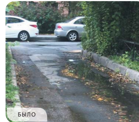
Финляндский проспект, дом 1