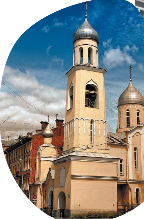
Церковь святой благоверной княгини инокини Анны Кашинской, Большой Сампсониевский проспект, дом 53

Церковь Анны Кашинской является подворьем Введенно-Оятского монастыря Тихвинской епархии Русской православной церкви на Выборгской стороне. Монастырь возвели в 1907 году на месте часовни в память чудесного спасения будущего императора Николая II в Японии.