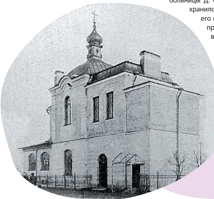
Храм святых Стратотерпцев царя Николая и царицы Александры, Литовская ул., дом 2 Ж