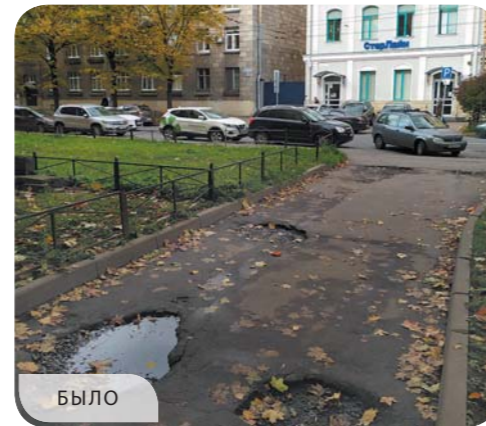
Лесной проспект, дом 4