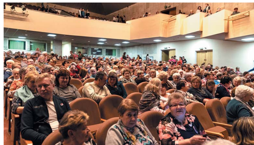
Зал был наполнен атмосферой весеннего настроения и улыбками зрителей. Гости порадовали артисты эстрады. Заключительным номером музыкальной программы стало выступление ВИА «Поющие гитары».