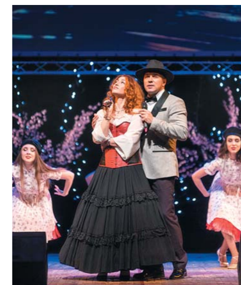
Заслуженные артисты России Альберт Асадуллин и Анатолий Тукиш, артистка Афина и другие популярные артисты исполнили свои известные песни.