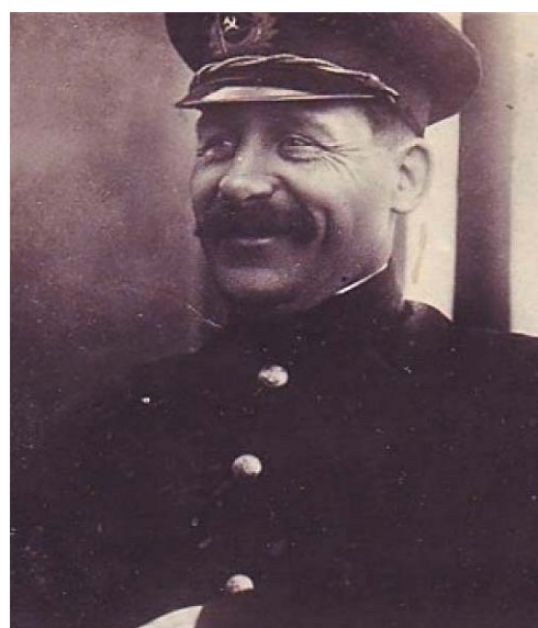
Владимир Иванович Воронин

Улица Капитана Воронина проходит от Большого Сампсониевского проспекта до улицы Харченко. Прежнее ее название — Муринский переулочек — было связано с существовавшей в первой половине XIX века Большой Муринской дорогой, которая вела в село Мурино. Новое имя улице присвоено в 1964 году в память о Владимире Ивановиче Воронине (1890-1952).