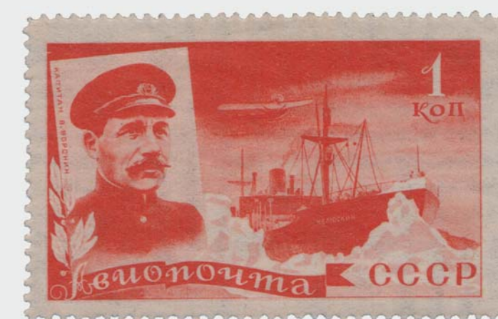
Марка номиналом 1 коп. памятного выпуска «Спасение челюскинцев»

Награжден двумя орденами Ленина (1932, 1944), орденом Красной Звезды (1933), орденом Трудового Красного Знамени (1936), орденом Знака Почета (1937), орденом Отечественной войны 2-й степени (20.11.1943), орденом Отечественной войны 1-й степени (12.04.1945) орденом Нахимова 2-й степени (02.12.1945), медалями.