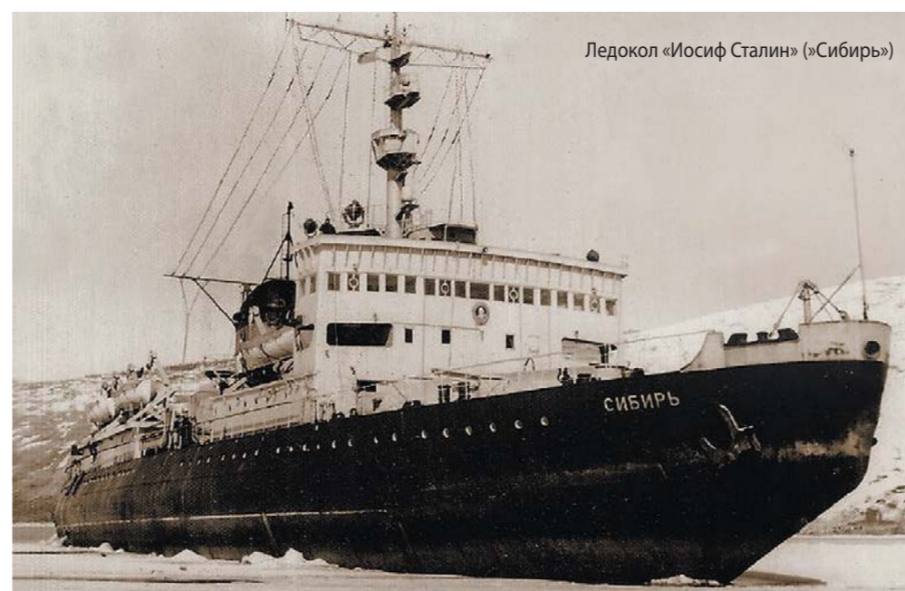
Ледокол «Иосиф Сталин» («Сибирь»)

Позднее, Воронин В.И. участвовал в героическом походе «Челюскина» из Мурманска во Владивосток, отрабатывая схему доставки грузов по трассе Северного морского пути за одну навигацию. Пароход встретил сплошные льды, был