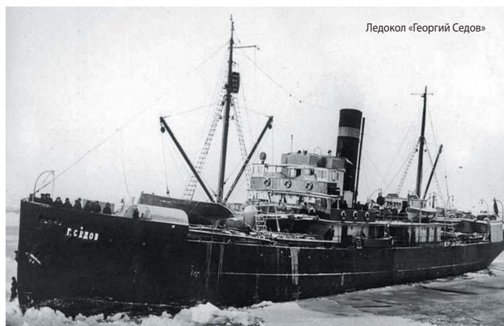
Ледокол «Георгий Седов»

В 1929 – 1930 гг. «Георгий Седов» принял участие в научных экспедициях под руководством академика Отто Шмидта, когда была организована первая полярная станция Бухта Тихая на о. Гукера в центральной части Земли Франца-Иосифа. Исследователи открыли в северо-восточной части Карского моря неизвестные ранее острова, названные в честь участников экспедиции, в том числе Владимира Воронина.