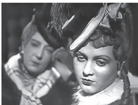
Кадр из фильма «Пышка»

торским текстом. Впоследствии великий режиссер и великая актриса оставались друзьями на протяжении жизни. Хотя после «Мечты» в роковом 1941-м совместной работы у них больше не случилось.