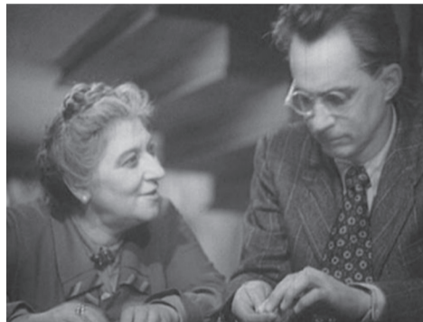
Фаина Раневская (Кадр из фильма «Мечта»)

Вершиной творчества Михаила Ромма считается картина «Мечта» (1941 г.). Снималась она перед самой войной.