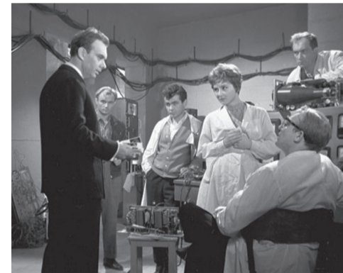
Алексей Баталов, Татьяна Лаврова и Иннокентий Смоктуновский (кадр из фильма «Девять дней одного года»)

Смоктуновским, Татьяной Дорониной, многими из тех, кто составил ядро театра «Современник». Непринужденность киноповествования, свободная композиция, блистательные диалоги и монологи молодых гениев от науки, сосредоточенность вместе с тем людей на своих проблемах – все привлекало в фильме. Но в картине о ядерщиках самым, может быть, главным оказалась мысль о глобальном катастрофизме XX века.