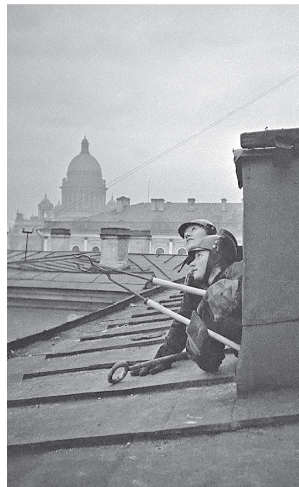
Дежурство на крыше.

ВАЛЕНТИН ПАВЛОВИЧ ВАСИЛЬЕВ, житель МО Сампсониевское